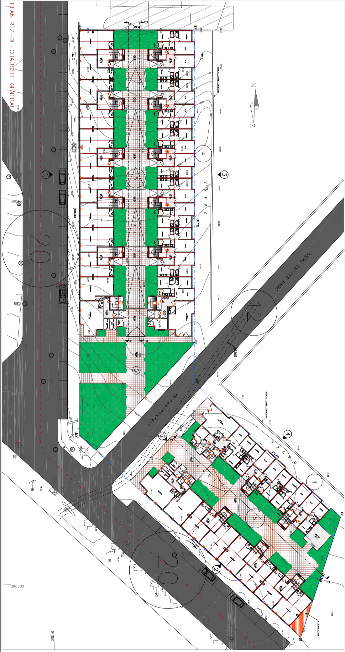
PLAN REZ-DE-CHAUSSEE GENERAL