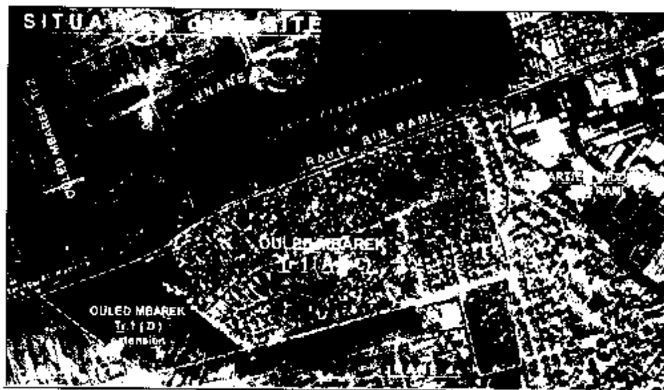
SITE Du Secteur OULED MBAREK-Tranche 1/A-B-C-D

L'assiette cadastrale totale est de 57ha. 76a. 59ca.