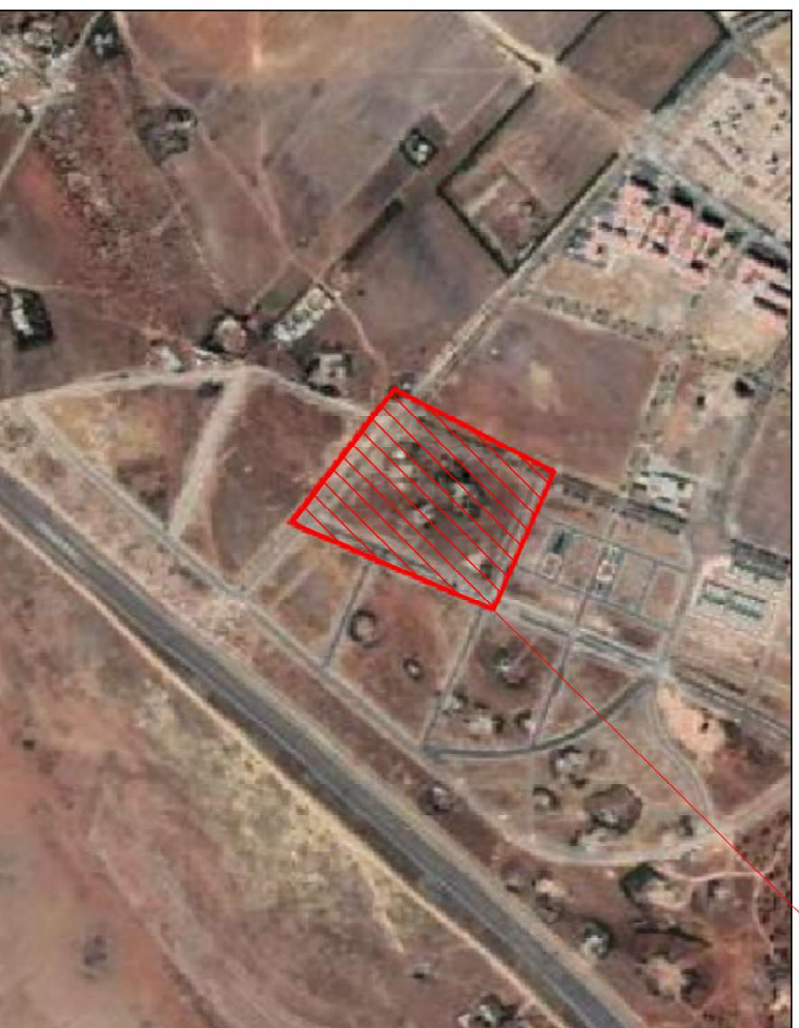
Situation sur Image Satellite