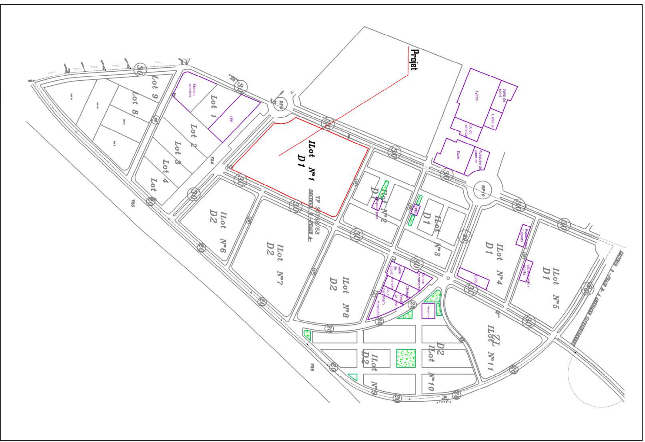
Situation sur le Plan de masse