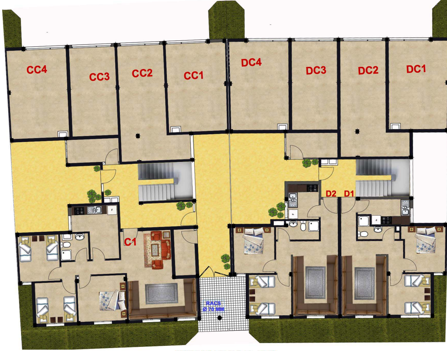
IMMEUBLES C & D - RDC