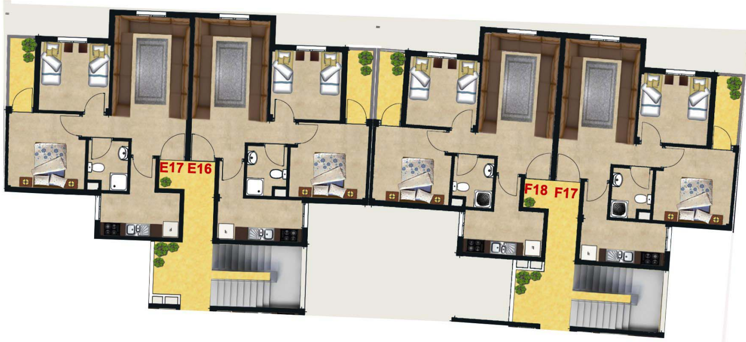
IMMEUBLES E & F 4EME ETAGE HAUT