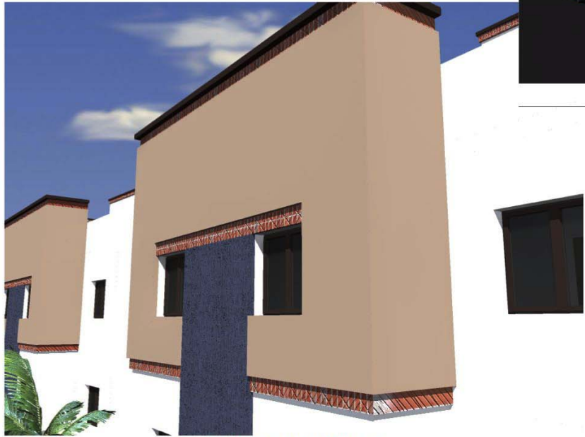
SAFAE TR2 VUE 9