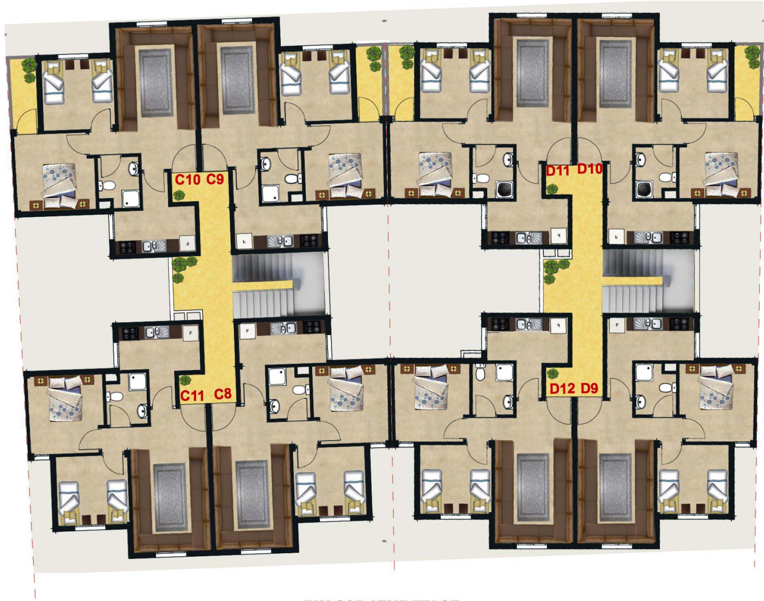
IMM C&D 3EME ETAGE