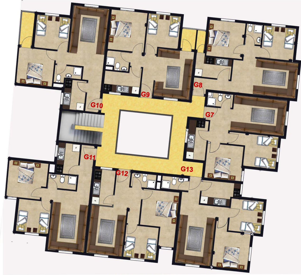
IMMEUBLE G 2EME ETAGE