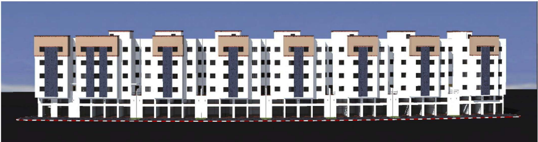
SAFAE TR2 VUE 6