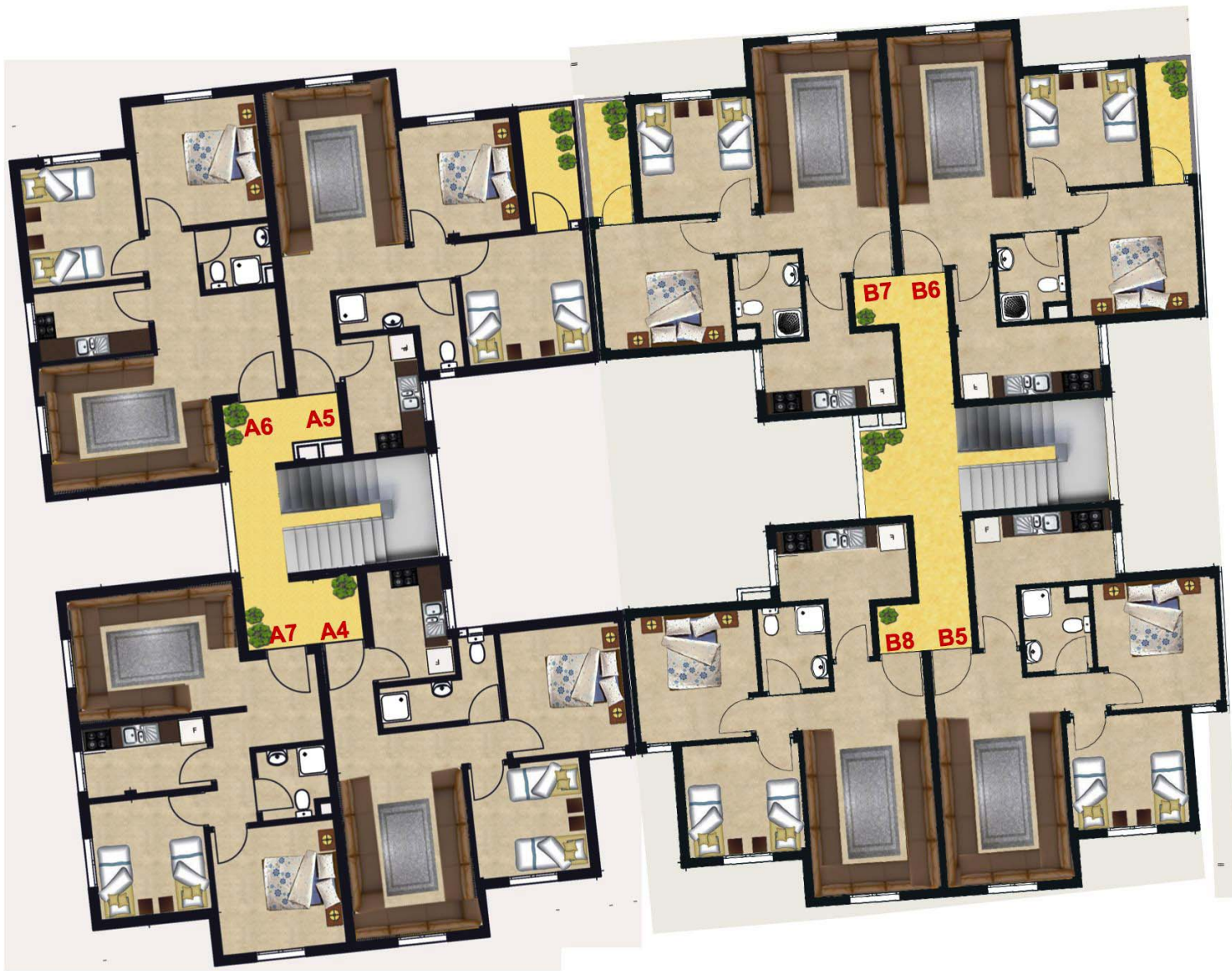
IMM A&B 2EME ETAGE