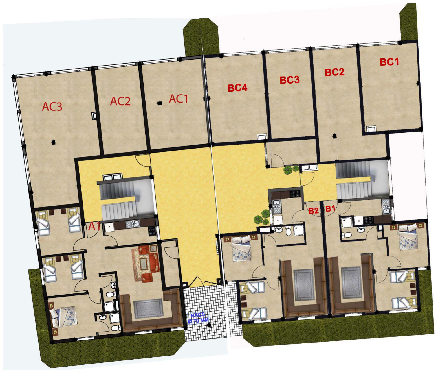
IMMEUBLES A&B -RDC