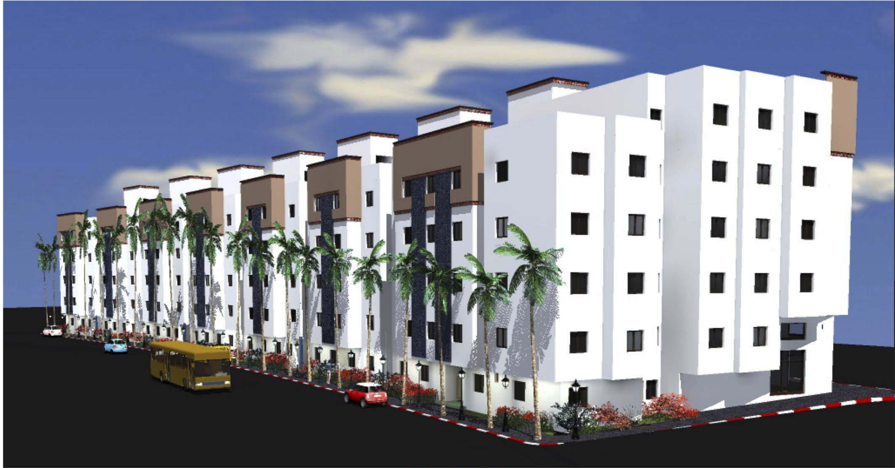
SAFAE TR2 VUE 4