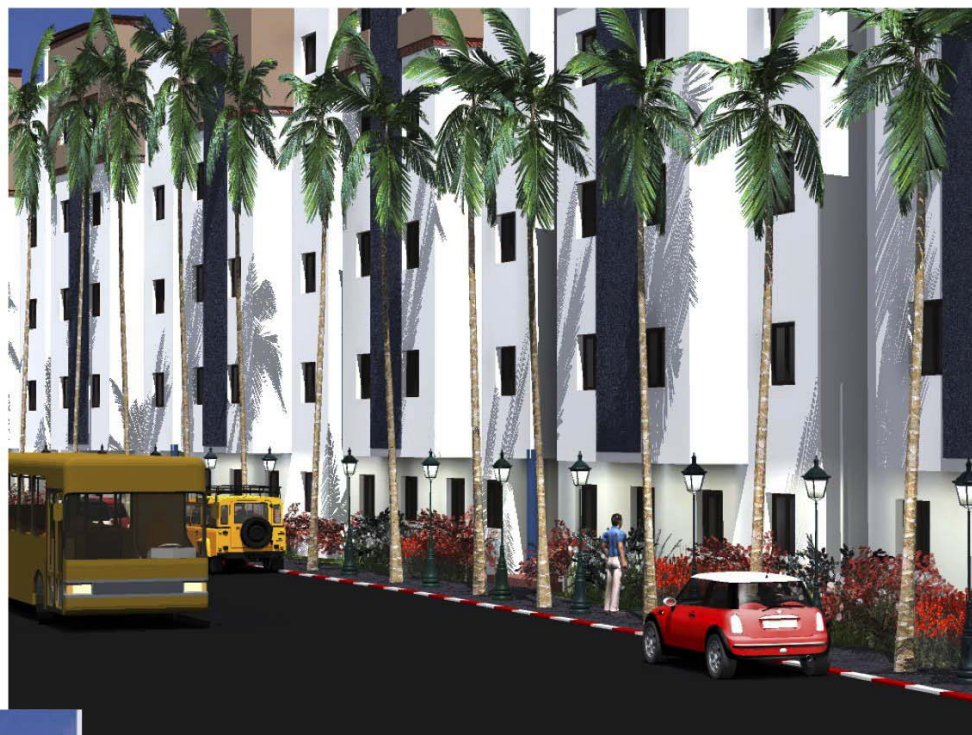
SAFAE TR2 VUE 2