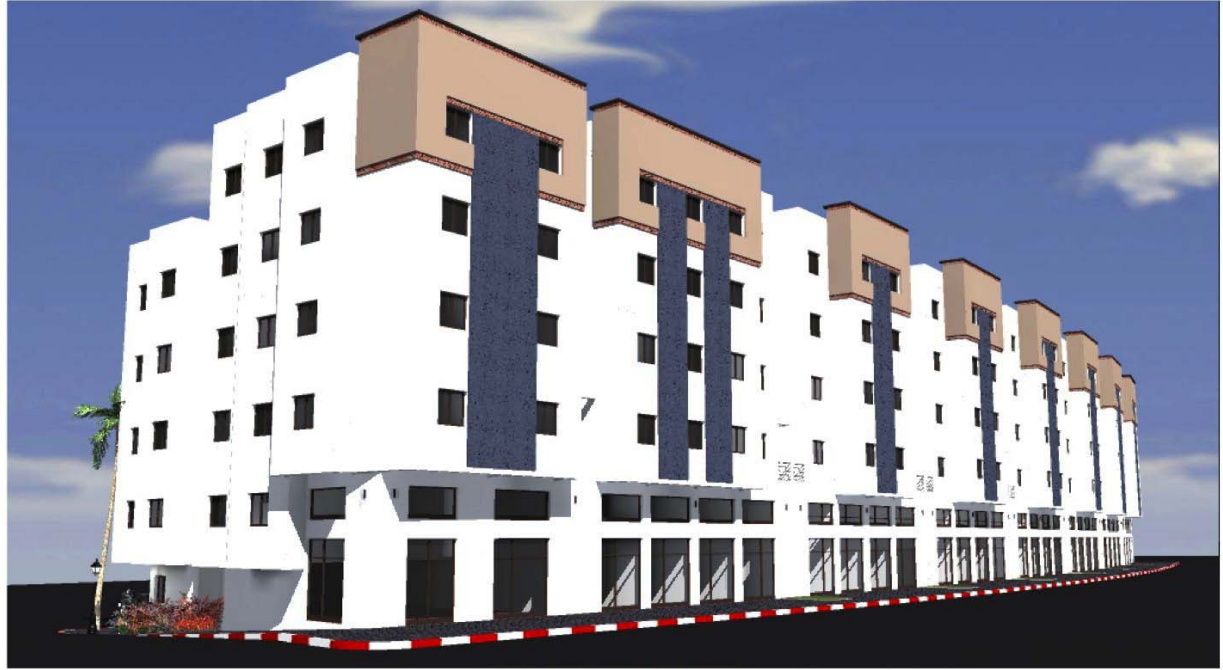
SAFAE TR2 VUE 5