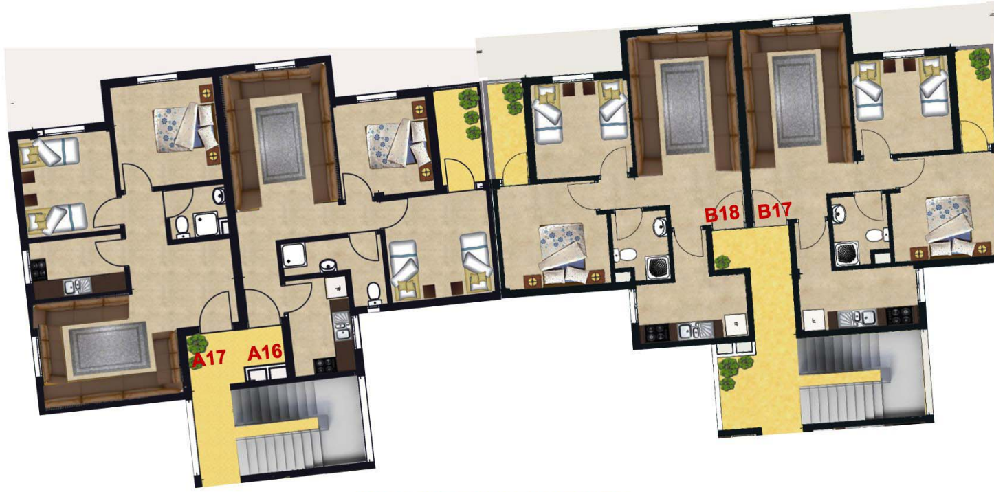
IMM A&B 4EME ETAGE HAUT