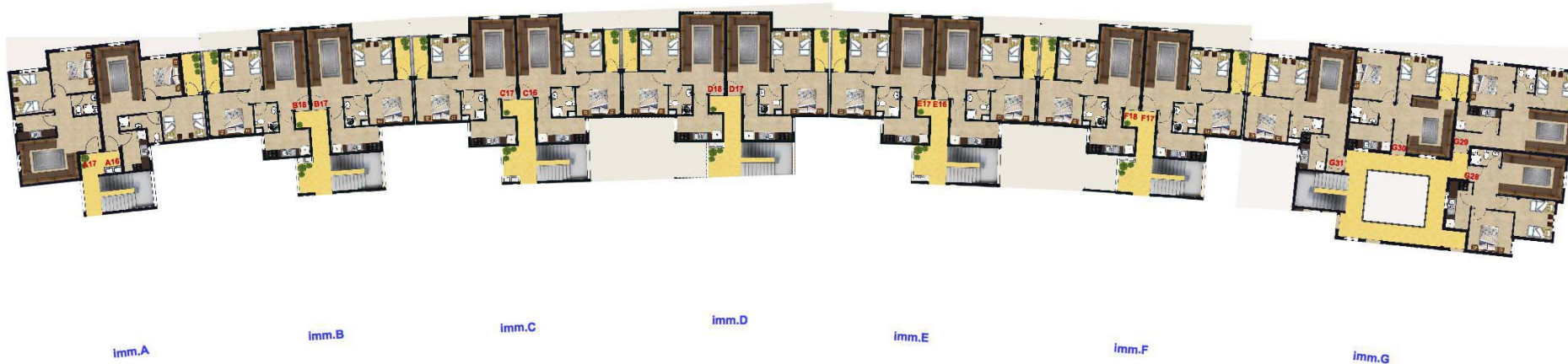
4 EME ETAGE HAUT/TERRASSE BASSE