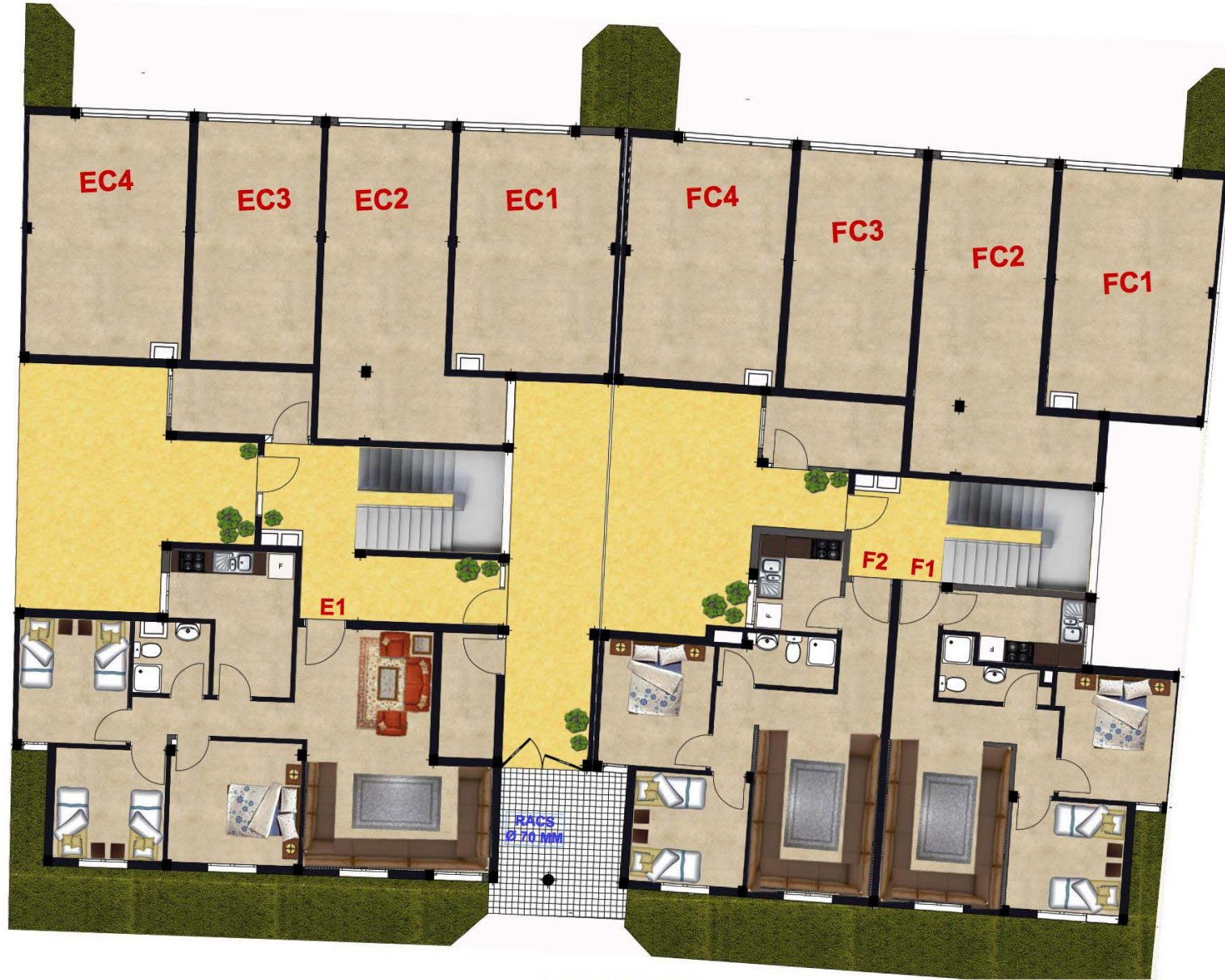
IMM E&F- RDC