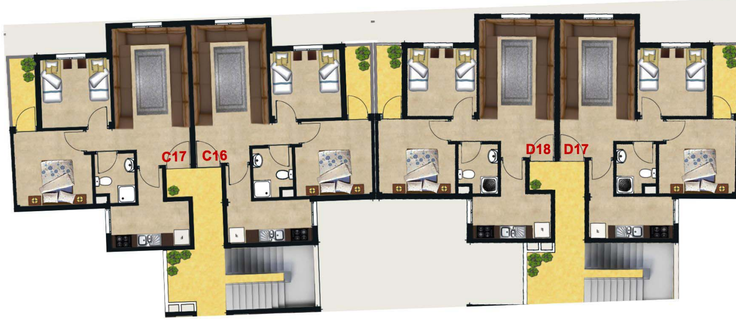
IMMEUBLES C & D 4EME ETAGE HAUT