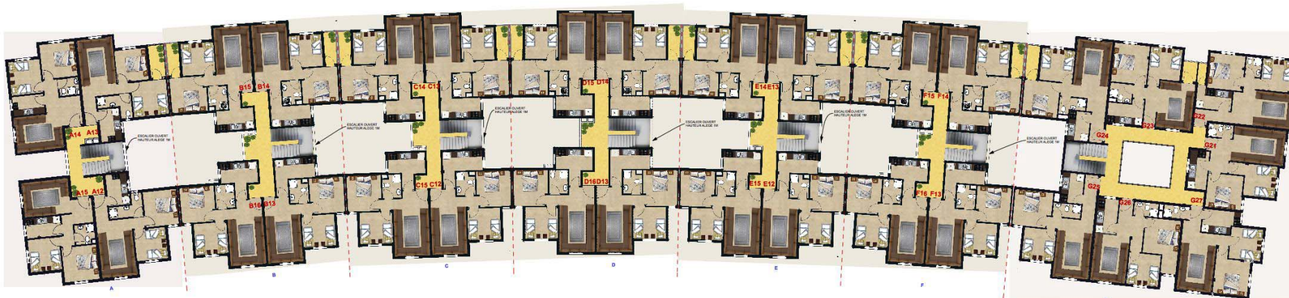
4EME ETAGE BAS/3EME ETAGE HAUT