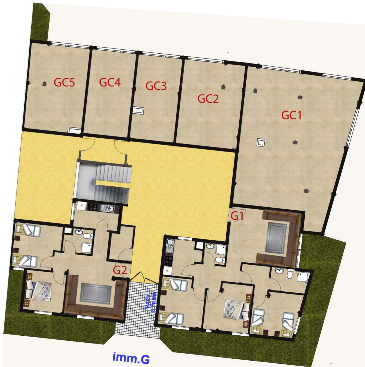
IMMEUBLE G -RDC