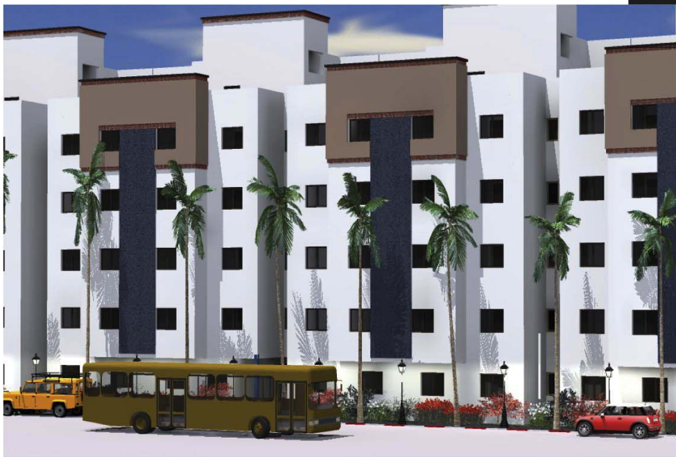
SAFAE TR2 VUE 1