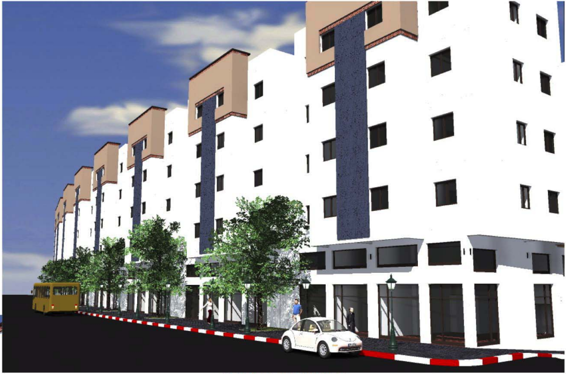
SAFAE TR2 VUE 7