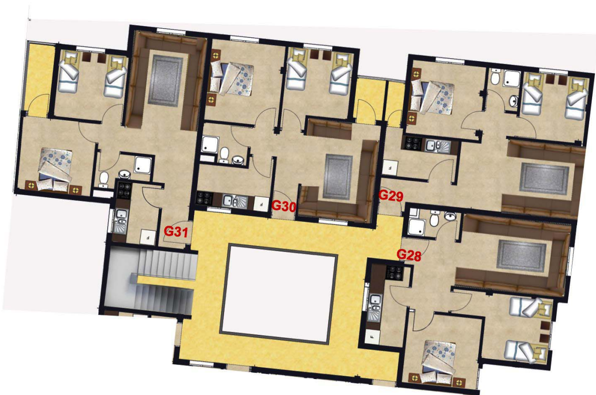
IMMEUBLE G 4EME ETAGE HAUT