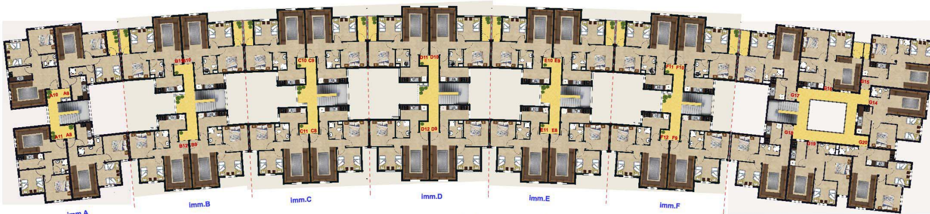
3EME ETAGE BAS/ 2EME ETAGE HAUT