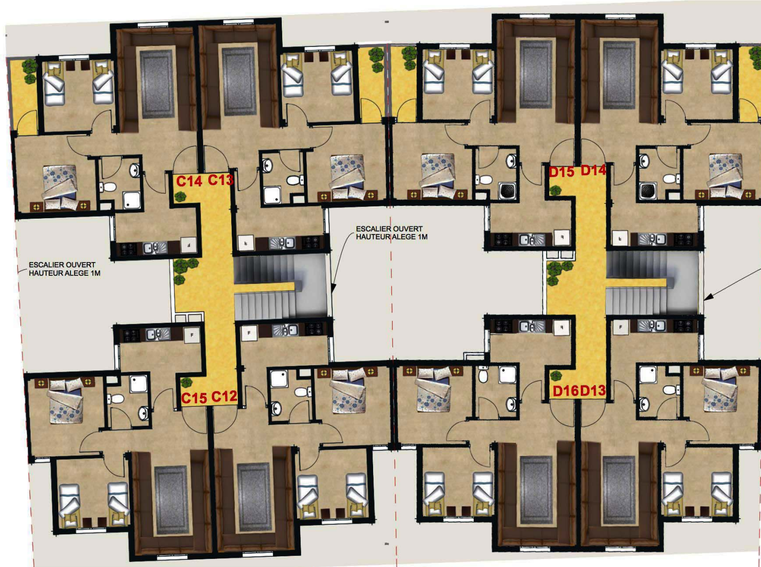
IMM C&D 4EME ETAGE