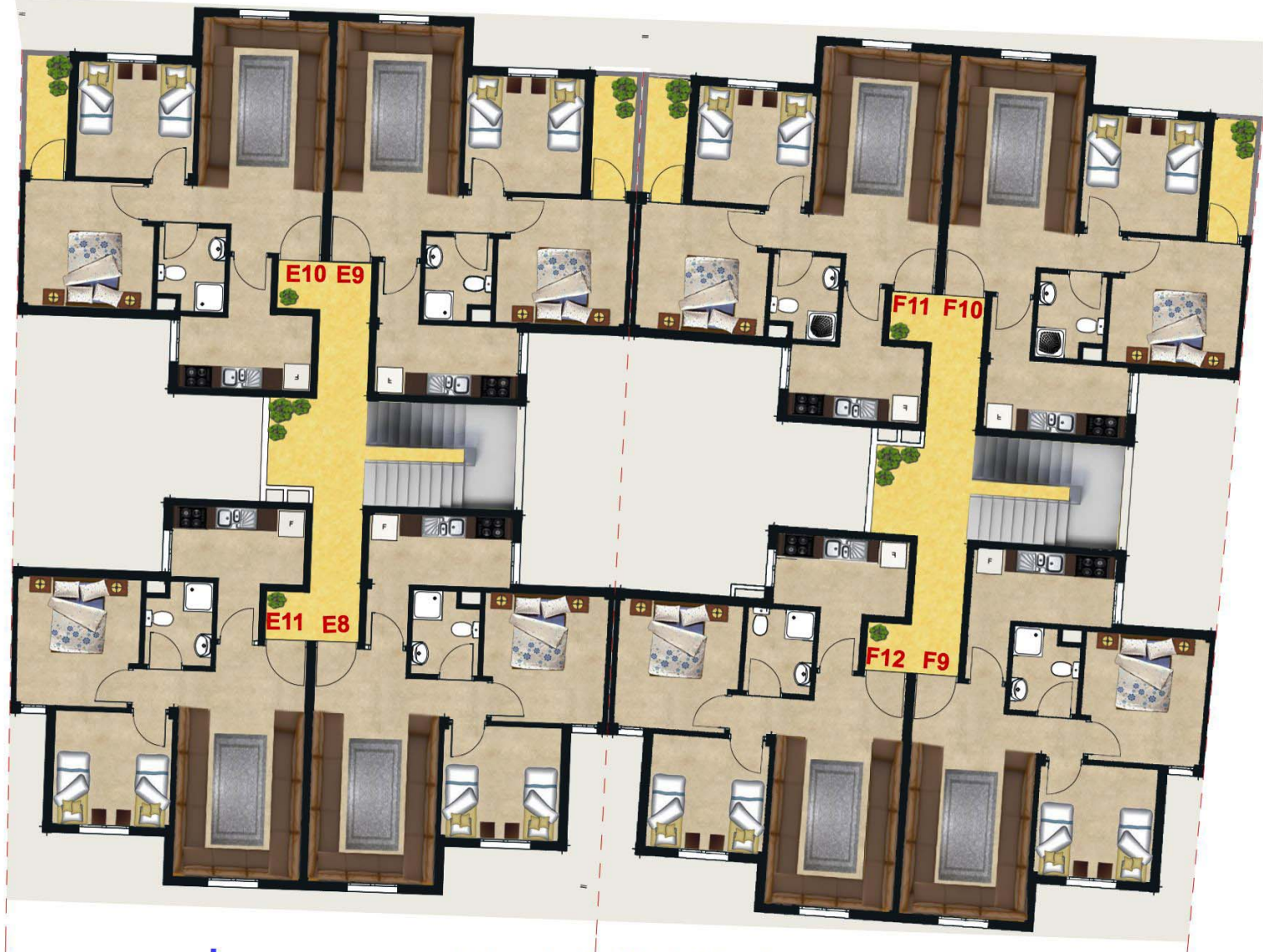
IMMEUBLES E & F 3EME ETAGE