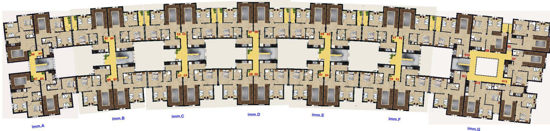
2 EME ETAGE BAS/1ER ETAGE HAUT