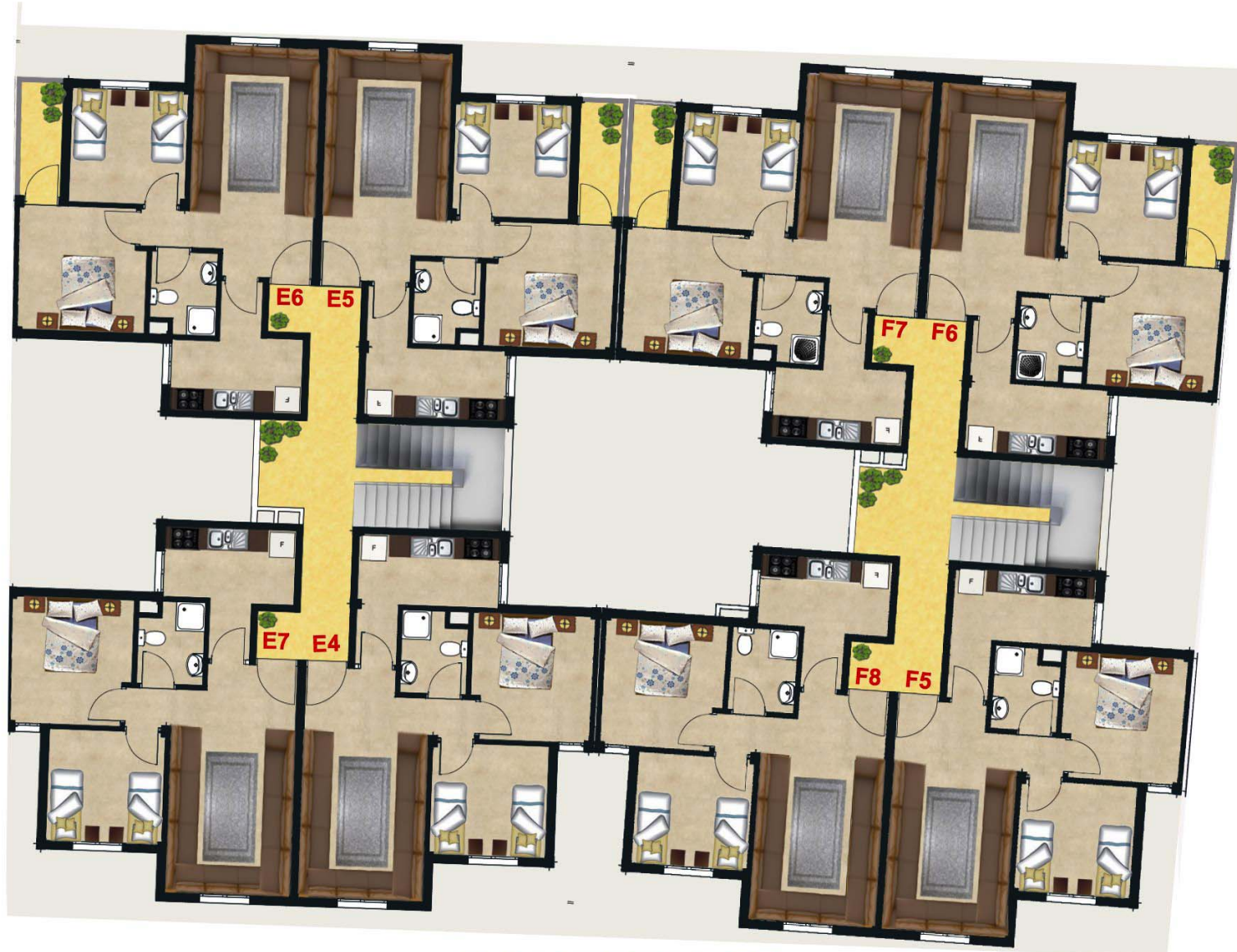
IMMEUBLES E & F 2EME ETAGE