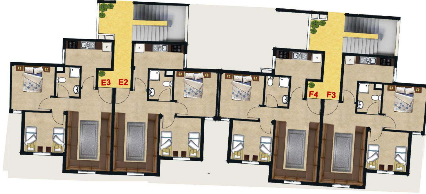
IMM E&F 1EME ETAGE V/COMM