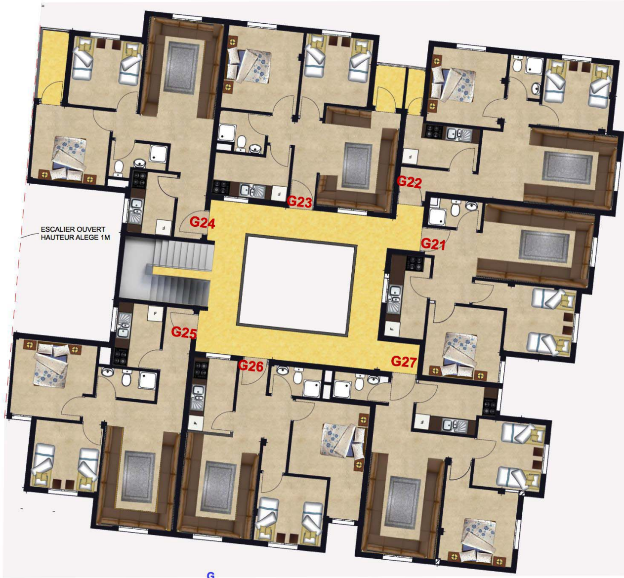
G IMMEUBLE G 4EME ETAGE