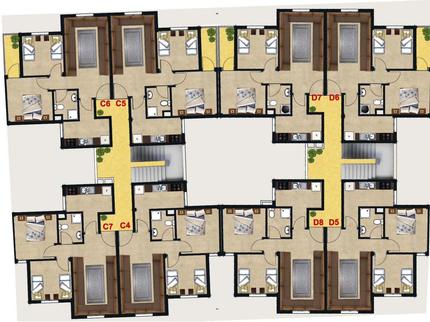
IMM C&D 2EME ETAGE