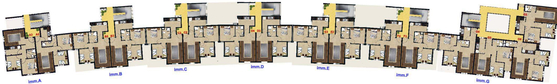
1ER ETAGE EST/VIDE SUR COMMERCE