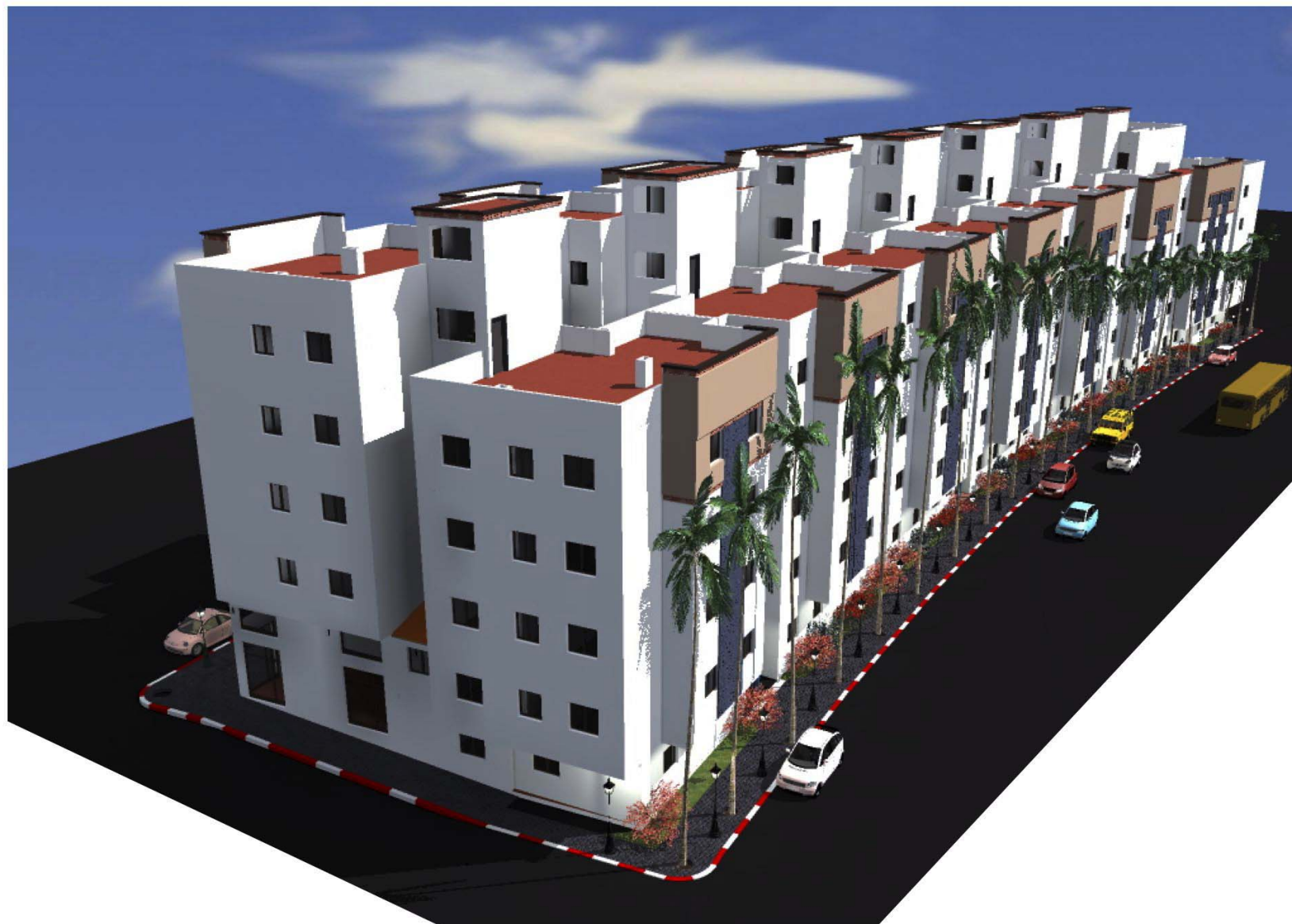
SAFAE TR2 VUE 8