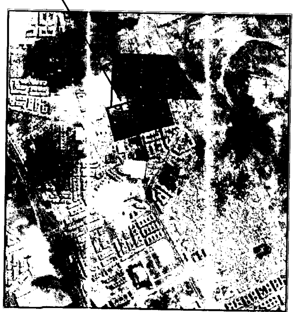
PLAN DE SITUATION