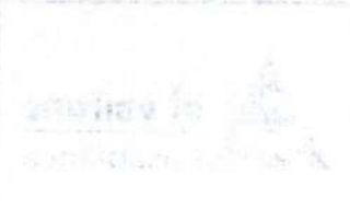
Table showing the comparison of the results of the examination of the candidates for the post of Lecturer in the various faculties of the University of Baghdad, for the years 1982-83, 1983-84 and 1984-85.