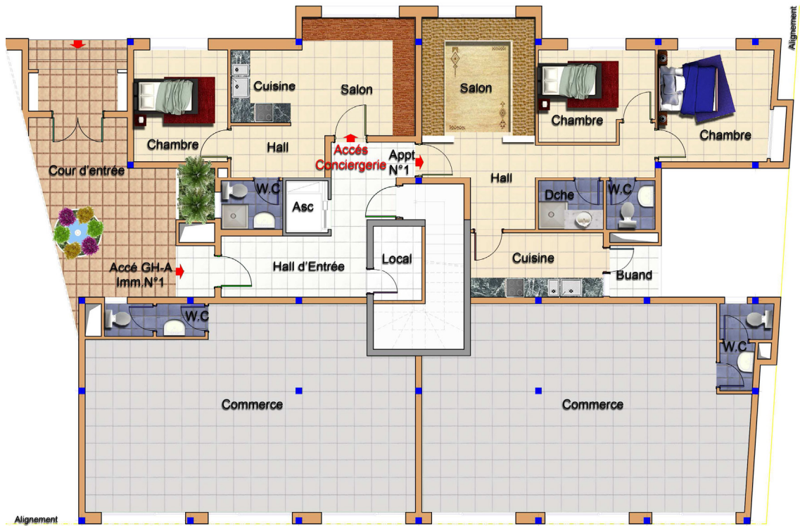
PLAN REZ DE CHAUSSEE - TYPE GH A