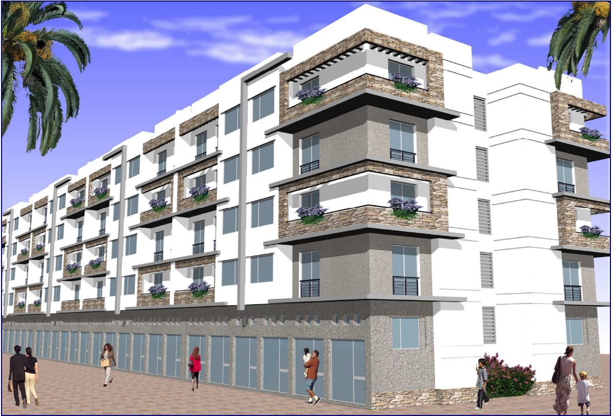
PERSPECTIVE DU PROJET - VUE 2