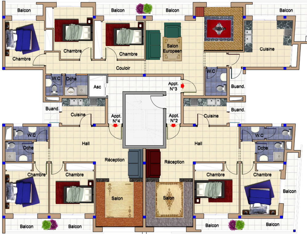
PLAN ETAGE COURANT – TYPE GH A