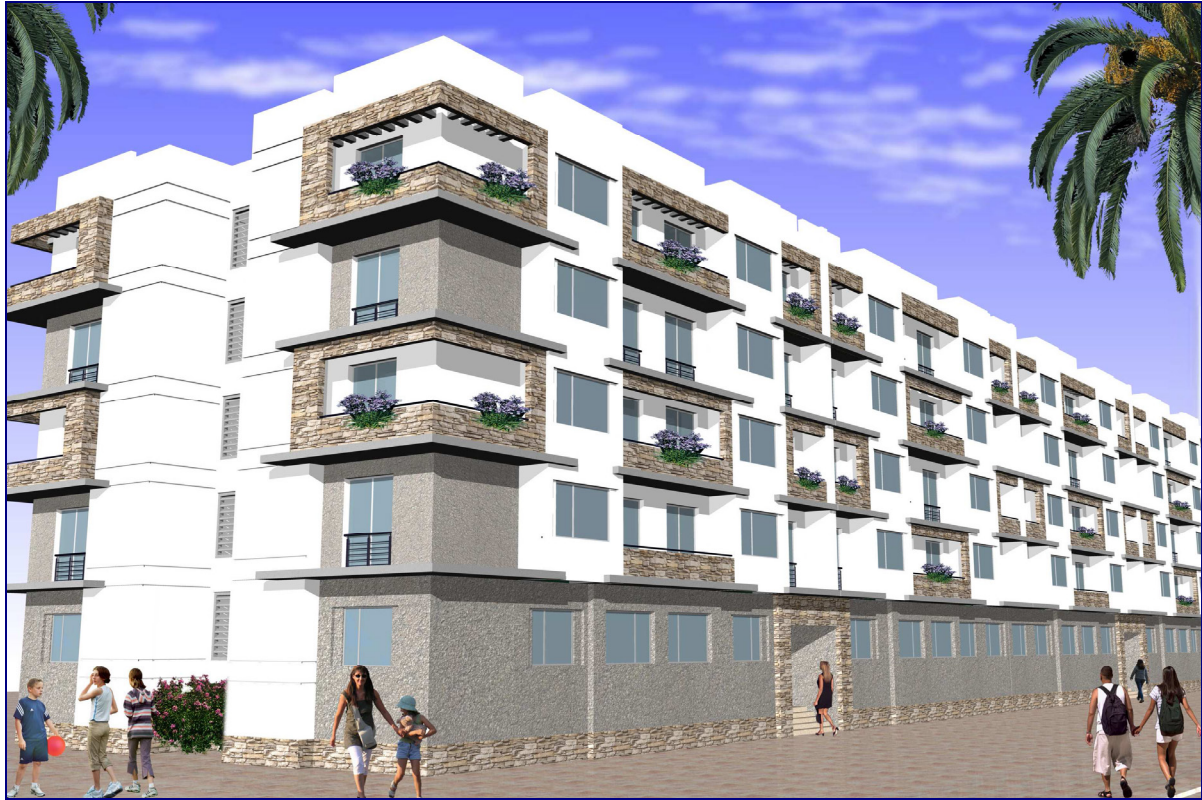
PERSPECTIVE DU PROJET – VUE 1