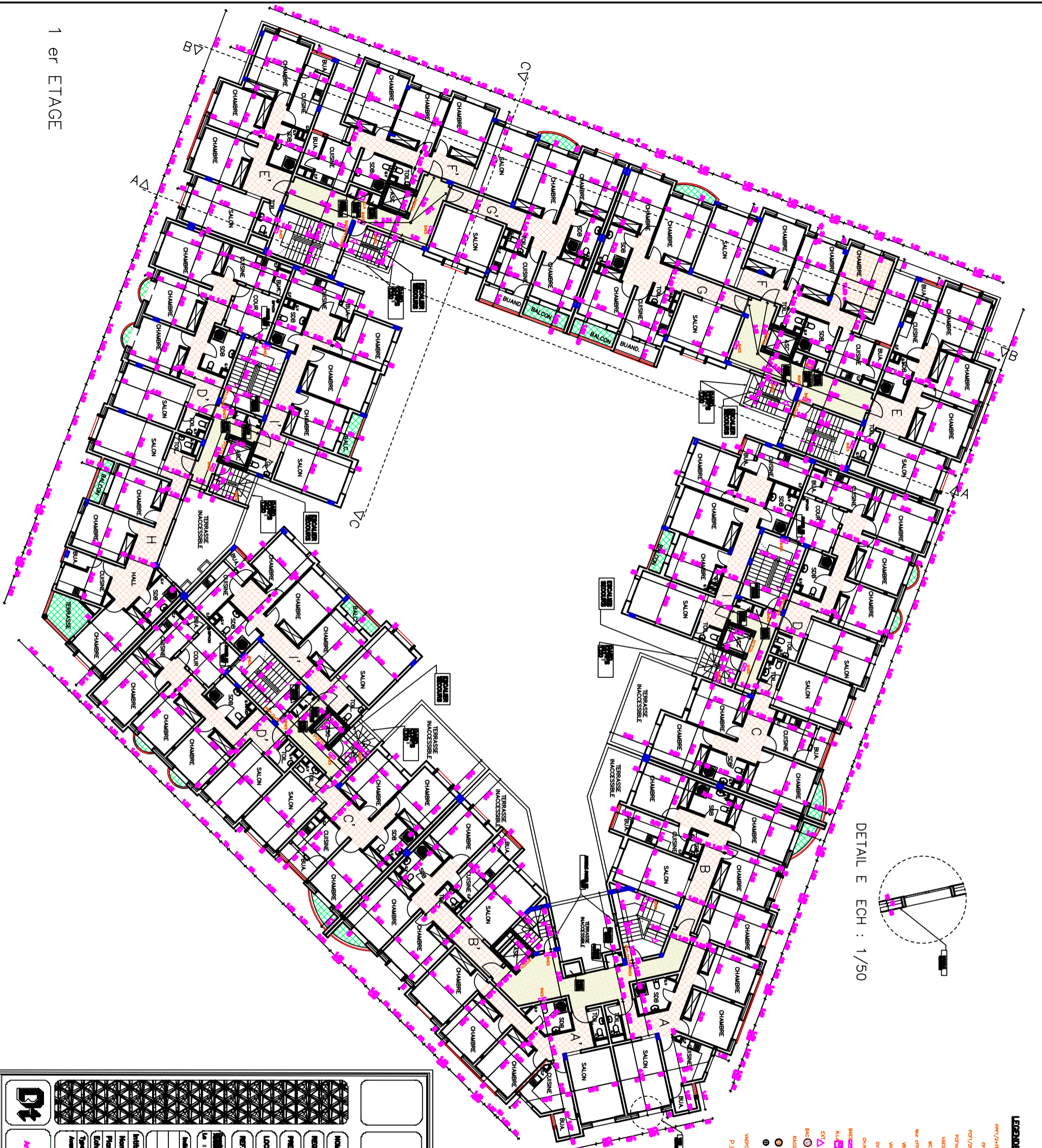
DETAIL E ECH : 1/50