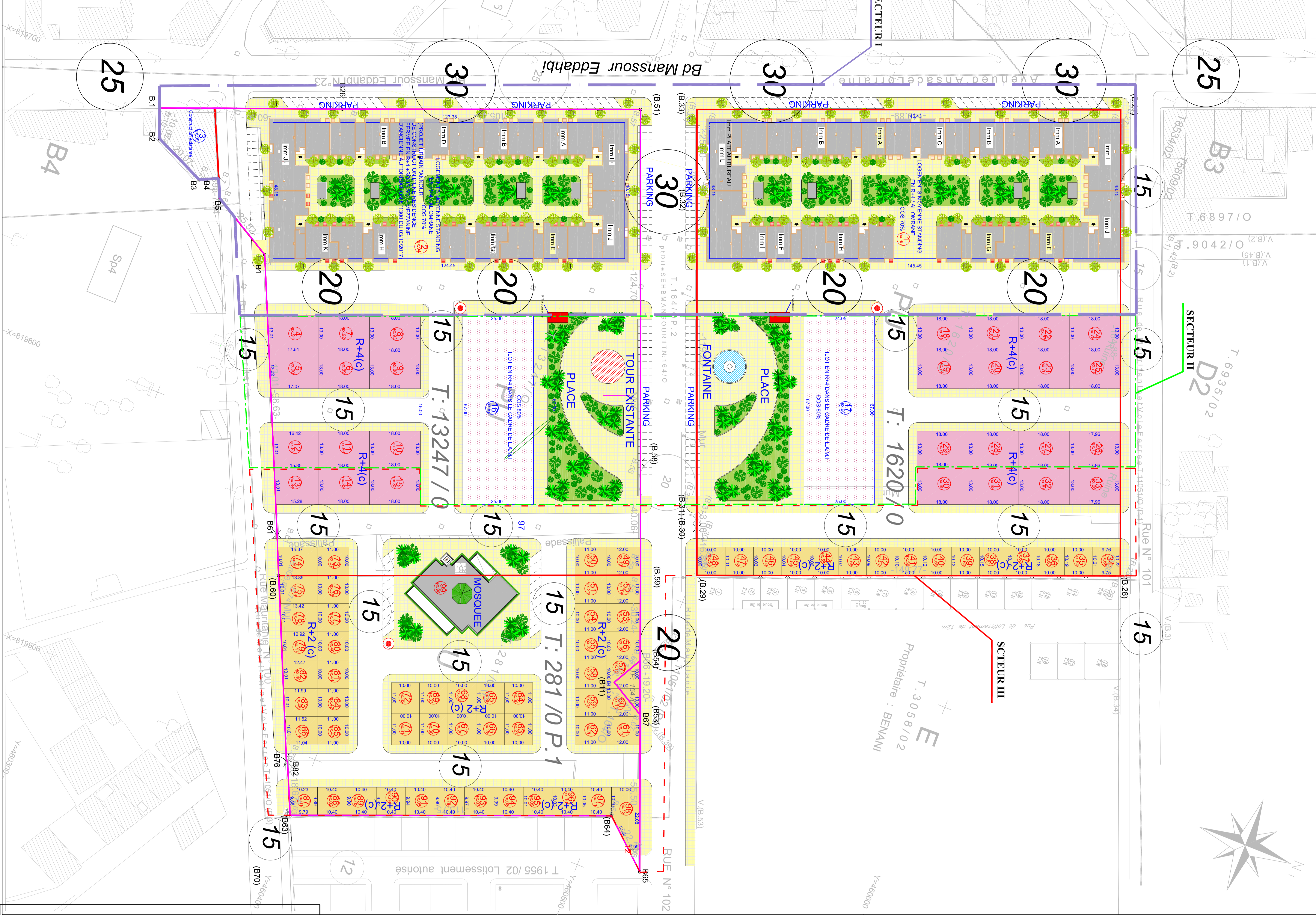
PLAN DE SITUATION EXTRAIT DU P.A